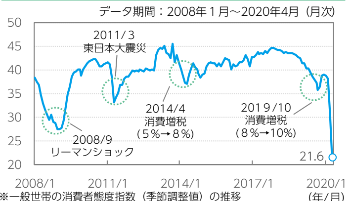
図表3：消費者心理は急速に悪化している