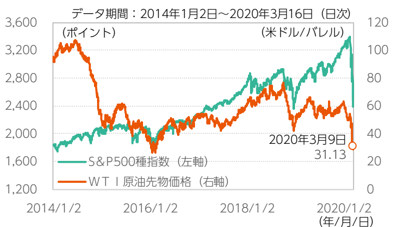
図表1：減産交渉決裂を受け原油価格と米国株式は大幅下落

かつては相関が見られなかった原油価格と米国株式は、2015年頃から値動きに連動性が見られます（図表1）。近年のシェールオイル開発の進展により、原油生産量が急増し米国はサウジアラビアやロシアを抜いて世界最大の産油国となったことから、原油安が米エネルギー関連企業に与える悪影響はかつてよりも大きく、エネルギー関連企業の業績悪化懸念が米国株式市場の大幅下落の一因となっているものと考えられます（図表2）。