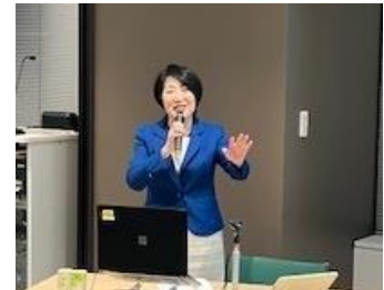
片倉氏による講演

・Involve社「Heroes Women Role Model List」日本初の殿堂入り